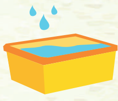
RECIPIENTE CON AGUA